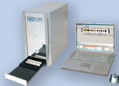
SirScan® micro PLUS